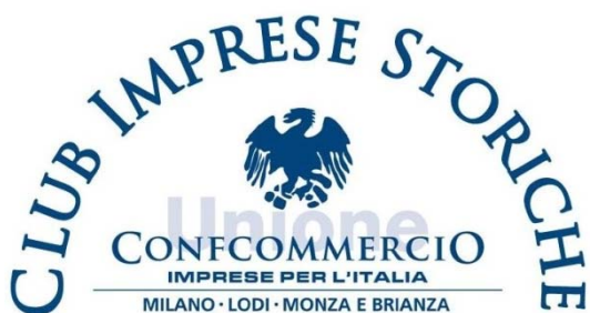
Logo del Club Imprese Storiche che verrà sostituito.

Il nuovo marchio dovrà sostituire il logo utilizzato attualmente, che consiste nel logo di Confcommercio Milano Lodi Monza e Brianza con l'aggiunta della dicitura Club Imprese Storiche , illustrato di seguito: